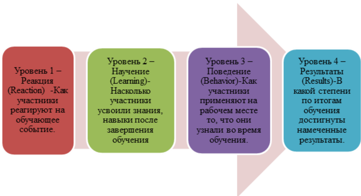
Рис. 1 - Модель Киркпатрика

Таким образом, к оценке эффективности процесса обучения необходимо подходить с позиций финансового менеджмента и количественно оценивать результаты от такого инвестирования. Решение данной задачи было предложено в 1997 году Джеком Филипсом.